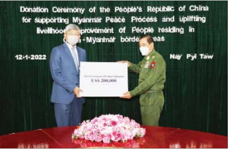
နှင့် ဖွံ့ဖြိုးတိုးတက်ရေး၊ လူ့စွမ်းအားအရင်းအမြစ်ဖွံ့ဖြိုးရေးဆိုင်ရာလုပ်ငန်းများနှင့်ပတ်သက်၍ ဆက်လက် ပူးပေါင်းဆောင်ရွက်မည့်ကိစ္စရပ်များကို ရင်းနှီးပွင့်လင်းစွာ ဆွေးနွေးခဲ့ကြကြောင်း သိရသည်။ သတင်းစဉ်

ရှေးဦးစွာ တရုတ်ပြည်သူ့သမ္မတနိုင်ငံ သံအမတ်ကြီး မစ္စတာ ချန်းဟိုင်က မြန်မာနိုင်ငံ၏ အပစ်အခတ်ရပ်စဲမှု ငြိမ်းချမ်းရေးဖော်ဆောင်မှုတို့ကို တိုးမြှင့်ရန်နှင့် တရုတ် - မြန်မာနယ်စပ်ဒေသ၌ နေထိုင်သည့် ပြည်သူများ၏ လူနေမှုဘဝတိုးတက်ရေးတို့အတွက် ရည်ရွယ်၍ တရုတ်ပြည်သူ့သမ္မတနိုင်ငံမှ လှူဒါန်းငွေများ ပေးအပ်လှူဒါန်းခြင်း ဖြစ်ကြောင်း ရှင်းလင်းပြောကြားသည်။ ထို့နောက် တရုတ်ပြည်သူ့သမ္မတနိုင်ငံအစိုးရ ကိုယ်စား မြန်မာနိုင်ငံဆိုင်ရာ တရုတ်သံအမတ်ကြီး က လွှဲပြောင်းပေးအပ်လှူဒါန်းသော အမေရိကန် ဒေါ်လာ နှစ်သိန်းကို ပြည်ထောင်စုဝန်ကြီးက လက်ခံ ရယူပြီး ဂုဏ်ပြုမှတ်တမ်းလွှာနှင့် အမှတ်တရ လက်ဆောင်ပစ္စည်းများ ပြန်လည်ပေးအပ်သည်။ ယင်းနောက် ပြည်ထောင်စုဝန်ကြီး ဒုတိယ ဗိုလ်ချုပ်ကြီး ထွန်းထွန်းနောင်က လှူဒါန်းငွေများ ပေးအပ်လှူဒါန်းခြင်းအတွက် ကျေးဇူးတင်စကား ပြောကြားကာ နယ်စပ်ဒေသများ တည်ငြိမ်အေးချမ်းရေး