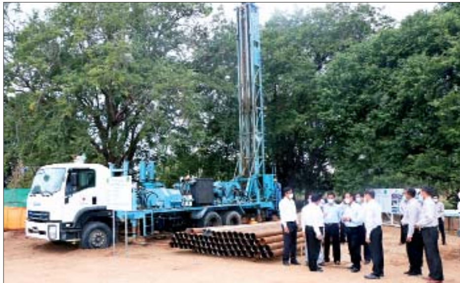
အသင်းလီမိတက်၏ မြန်မာ့လက်မှု ယွန်းထည်ပစ္စည်းများ ထုတ်လုပ်နေမှုကိုလည်းကောင်း၊ ပုဂံမြို့သစ် သီရိပစ္စယာရပ်ကွက်ရှိ သီရိလယ်ယာနှင့် အထွေထွေ စီးပွားရေးသမဝါယမအသင်းလီမိတက်၏ အုတ်ခွက် ဘုရားဆင်းတုတော်များနှင့် သံပန်းချီကားချပ်များ ထုတ်လုပ်နေမှုကိုလည်းကောင်း လှည့်လည်ကြည့်ရှုအားပေးသည်။ ဆက်လက်၍ ပြည်ထောင်စုဝန်ကြီးနှင့်အဖွဲ့သည် အသေးစားစက်မှုလက်မှုလုပ်ငန်းဦးစီးဌာနအောက်ရှိ ယွန်းပညာကောလိပ်(ပုဂံ)ကို ကြည့်ရှုစစ်ဆေးပြီး

နေပြည်တော် ဇန်နဝါရီ ၁၂ သမဝါယမနှင့် ကျေးလက်ဖွံ့ဖြိုးရေးဝန်ကြီးဌာန ပြည်ထောင်စုဝန်ကြီး ဦးလှမိုးသည် ယမန်နေ့ မွန်းလွဲပိုင်းက မန္တလေးတိုင်းဒေသကြီးအတွင်း ယွန်းပညာကောလိပ်(ပုဂံ)နှင့် ကျေးလက်ဒေသဖွံ့ဖြိုးတိုးတက်ရေးလုပ်ငန်းများ ဆောင်ရွက်နေမှုကို ကွင်းဆင်းကြည့်ရှုစစ်ဆေးသည်။