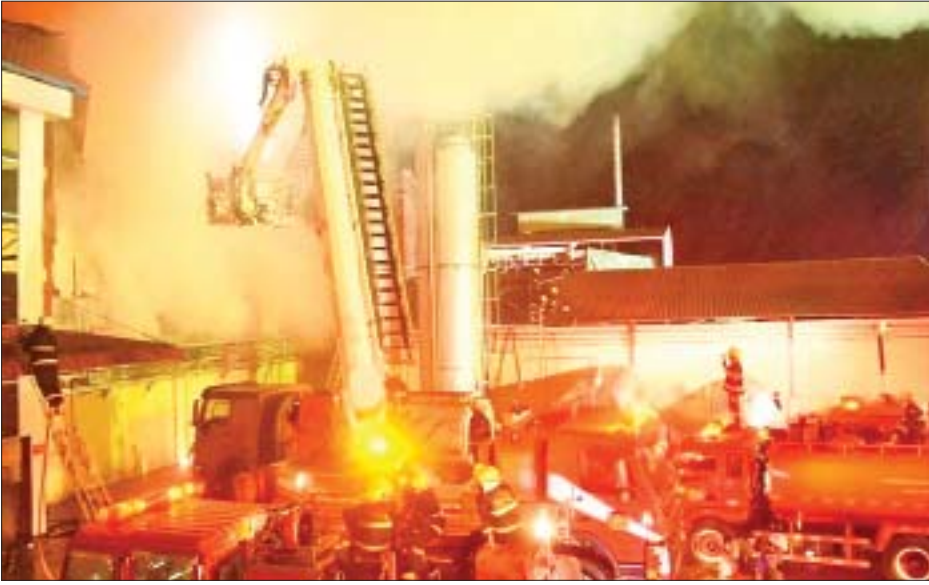
မီးလောင်မှုကိုစွမ်းစွမ်းတမ်းတမ်းသတ်ခဲ့ကြသည့် မီးသတ်တပ်ဖွဲ့ဝင်များကို တွေ့ရစဉ်။

၂၀၂၀ ပြည့်နှစ်တွင် နိုင်ငံတစ်ဝန်းမီးလောင်မှု ၂၁၃၉ ကြိမ်ဖြစ်ပွားခဲ့ပြီး ၇၅ ဦးသေဆုံး၍ ၂၂၀ ဒဏ်ရာ ရရှိကာ ခန့်မှန်းတန်ဖိုးငွေကျပ် ၆ ဘီလီယံကျော် ဆုံးရှုံးခဲ့သည်။