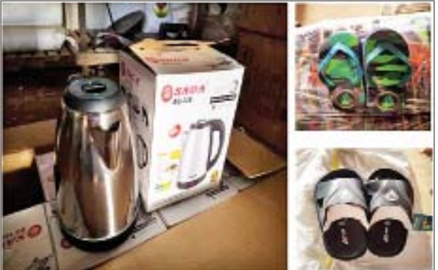
သိမ်းဆည်းရမိသည့် တရားမဝင် လူသုံးကုန်ပစ္စည်းများကို တွေ့ရစဉ်။

နေပြည်တော် ဇန်နဝါရီ ၁၂ တရားမဝင် ကုန်သွယ်မှု တိုက်ဖျက်ရေး ဦးဆောင်ကော်မတီ၏ ကြီးကြပ်ကွပ်ကဲမှုဖြင့် တရားမဝင်ကုန်သွယ်မှုများကို ဥပဒေနှင့်အညီ ထိရောက်စွာ တားဆီးအရေးယူနိုင်ရေး ဆောင်ရွက်လျက်ရှိရာ ဇန်နဝါရီ ၁၁ ရက်တွင် မရမ်းချောင်းအမြဲတမ်း စစ်ဆေးရေးစခန်း ပူးပေါင်းအဖွဲ့က Toyota Hiace ယာဉ်နှစ်စီးပေါ်မှ ခရီးသည်ပစ္စည်းများနှင့်အတူ ရောနှောသယ်ဆောင်လာသော တရားဝင်စာရွက်စာတမ်း အထောက်အထား တစ်စုံတစ်ရာ တင်ပြနိုင်ခြင်းမရှိသည့် လျှပ်စစ်ရေခန်းအိုး ၃၉၀ ၊ ဖိနပ်အစုံ ၅၈၀၊ လျှပ်စစ်ဒယ်အိုး ၁၀၀၊ ခေါင်းလိမ်းဆီဘူး ၅၈၀ (ခန့်မှန်းတန်ဖိုး ငွေကျပ် ၇၉၁၅၀၀) ကို သိမ်းဆည်းရမိခဲ့သည်။