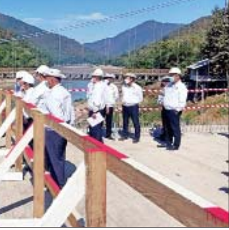
ခံနိုင်ရည်ရှိသော အိမ်ရာတည်ဆောက်ခြင်းဖြစ်၍ တံတားတည်ဆောက်ရေးလုပ်ငန်းများ သတ်မှတ်အချိန်မီပြီးစီးရေး၊ လုပ်ငန်းအားလုံး အရည်အသွေး ပြည့်မီရေး အထူးဂရုပြုဆောင်ရွက်ရန်လိုကြောင်းနှင့် လုပ်ငန်းခွင် ဘေးအန္တရာယ်ကင်းရှင်းရေး ဦးစားပေးဆောင်ရွက်ရန်မှာကြားပြီး တံတားတည်ဆောက်နေမှု လုပ်ငန်းများကို လိုက်လံကြည့်ရှုစစ်ဆေးသည်။ သံလွင်တံတား (တာဆန်း)သည် ရှမ်းပြည်နယ် (တောင်ပိုင်း)နှင့် (အရှေ့ပိုင်း) တို့ကို ဆက်သွယ်သည့် နမ့်စန်-မိုးနဲ-မိုင်းတုံ-မိုင်းဆတ် လမ်းပေါ်တွင် တည်ရှိပြီး