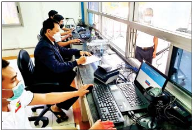
စာမျက်နှာ » ၅

ထိုင်းနိုင်ငံတွင် ရောက်ရှိအလုပ်လုပ်ကိုင်နေသည့် အလုပ်သမားများအတွက် CI သက်တမ်းတိုးစခန်းများ ခရိုင်ငါးခုတွင် ဖွင့်လှစ်ဆောင်ရွက်ပေးလျက်ရှိ